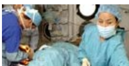
Cirugías y cuidados médicos