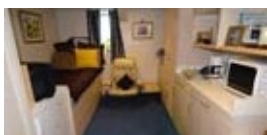
Camarotes de la tripulación