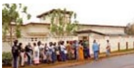
Programas en tierra