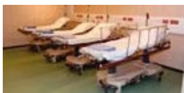
Sala de recuperación